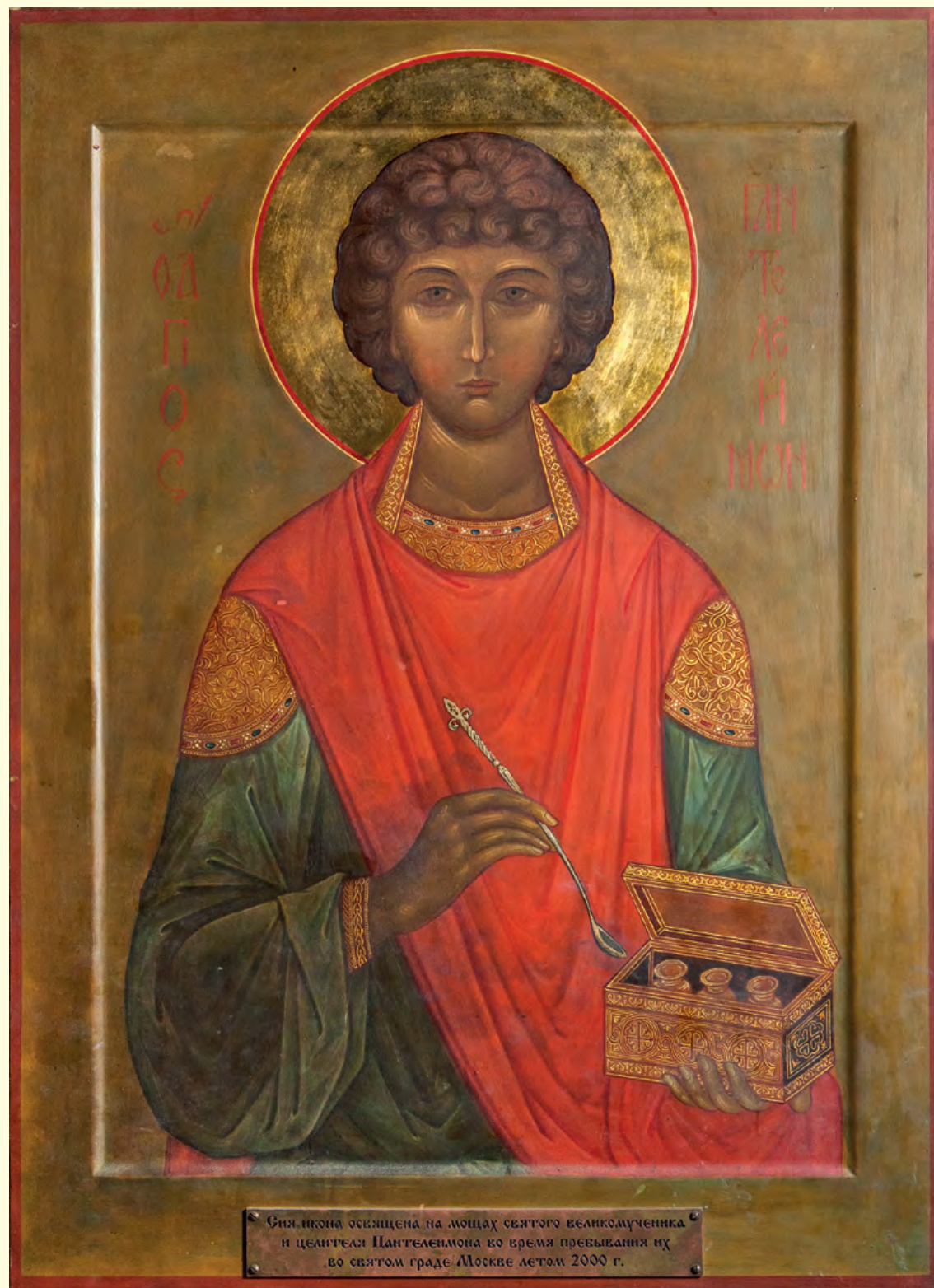
Эта икона освящена на мощах святого великомученика и целителя Пантелеимона во время превывания их во святом граде Москве летом 2000 г.

В еликомученик Пантелеимон (III в.) родился в Никомидии (Малая Азия), в семье знатного язычника и был назван Пантолеоном, что означает «лев во всем». О христианстве он впервые узнал от своей рано умершей матери, однако воспитание его оставалось языческим, пока он, уже будучи молодым талантливым врачом, не встретил тайно жившего в Никомидии пресвитера Ермолая, будущего священномученика. Ермолай открыл юноше истину о Христе, а окончательно тот уверовал, когда сам увидел, как по его молитве к Спасителю воскрес ребенок, ужаленный ехидной. После этого чуда Пантолеон был крещен святым Ермолаем с именем Пантелеимон (всемилоостивый).